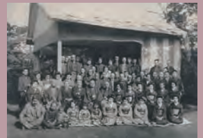
園遊会記念写真(大正8年、久米邸にて)