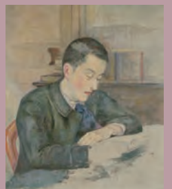
久米桂一郎「長田秋濤肖像」 1892(明治25年)