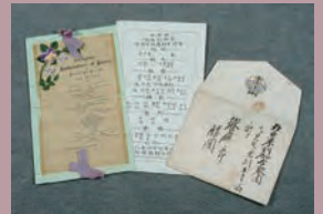
岩倉使節団が出席した晩餐会のメニュー(1872年)