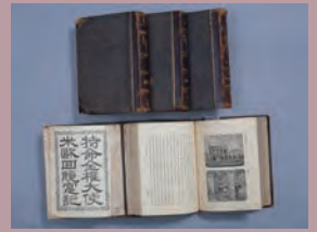
『米欧回覧実記』初版本(明治11年刊)